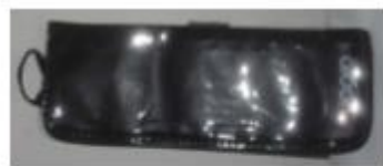
Postbeskrivelseholder Et slags armbånd til å ha postbeskrivelsen i, slik at man slipper å brette ut kartet hver gang man skal sjekke postnummeret, eller for å se litt proff ut.