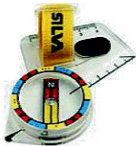
Tommelkompass Vanlig å bruke i o-løp

Man trenger kompass og stemplingsbrikke når man skal være med i løp. Brikke kan man i starten låne av klubben, og man kan også leie på løpene. Bildet under er av den type brikke man bruker i Norge, andre land har andre typer brikker.