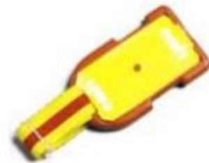
Stemplingsbrikke med backup-lapp