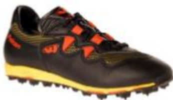
O-sko Lave joggesko med null demping og pigger som i et piggdekk. Ikke egnet til å løpe på parkett.