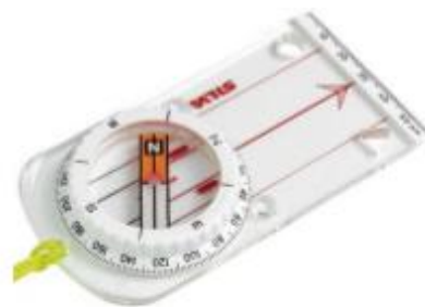
Turkompass Vanlig å bruke på tur og eventuelt på o-løp